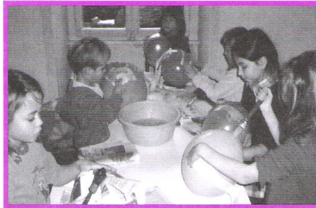
Atelier de fabrication de pignata de Noël

observer, appliquer, s'appliquer, se découvrir, s'ouvrir aux autres, s'enthousiasmer, grandir tout en partageant ses envies et en développant son univers.