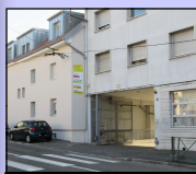
Le FJT de la Cassotte