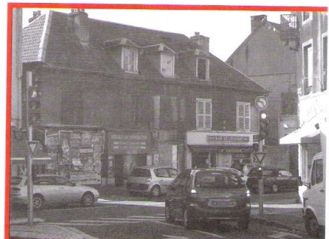
RUE DE BELFORT, ÎLOT RAMBAUD, QUELLE OPÉRATION IMMOBILIÈRE SE PRÉPARE ?

injustice : les mesures de coût préférentiel pour les riverains ne s'appliquent que sur la foi de l'adresse liée à la plaque d'immatriculation : les locataires, entre autres, de studios immatriculés ailleurs (à leur adresse familiale ?) n'y auront donc pas droit ! Pour toutes ces raisons, nous avons adressé un courrier à la mairie afin que soient réétudiées cette question du stationnement payant.