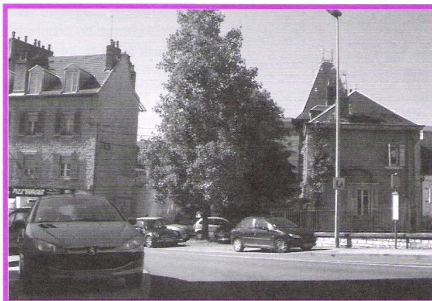
Bas rue du Chasnot, les problèmes de stationnement

Les occupants des logements situés entre cette rue et la rue Garibaldi rencontrent de nombreux problèmes : stationnement intempestif de véhicules devant les portillons d'accès à cet ensemble immobilier géré par Néolia, bruit des clients fréquentant les commerces situés à proximité, dégradations diverses...etc. Les habitants en sont à leur troisième pétition ! De guerre lasse, des locataires déménagent ! Il faut régler cette situation au plus vite afin de garantir la sécurité des habitants. Nous avons déjà adressé plusieurs messages à la mairie afin que soient étudiés les équipements dissuasifs au stationnement gênant. Ce serait l'occasion également de créer une place de stationnement réservée aux handicapés. Pour l'instant, aucune réponse concrète ! Faudra-t-il que des incidents surviennent pour que des solutions soient étudiées ?