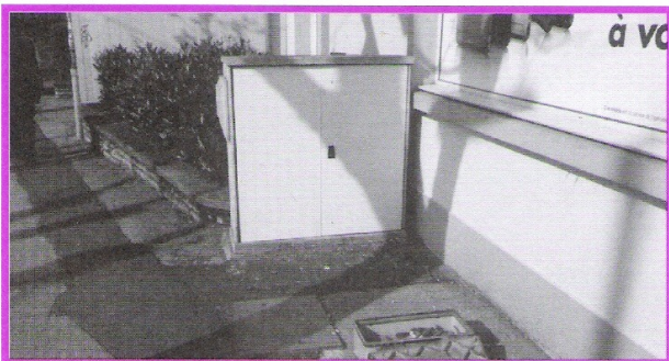
Armoire électrique enfin réparée

Place Flore, rue des Chaprais, rue de Belfort les armoires techniques délabrées : enfin réparées !