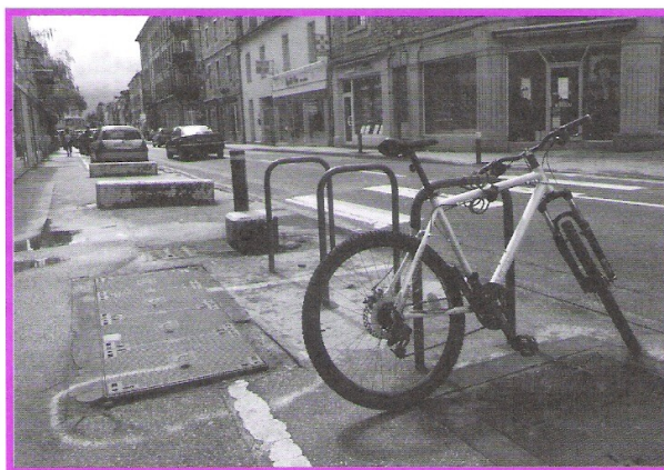
Les trous dans les trottoirs, rue de Belfort

L'association est intervenue à plusieurs reprises sur la dangerosité des trottoirs dans le quartier, mis à mal par de nombreux travaux et par un hiver rigoureux. Quelques rafistolages d'urgence ont été faits ce printemps, mais de nombreux trous subsistent, Vivre aux Chaprais est passé à l'action début mai 2010. Les trous les plus dangereux ont été entourés de traits à la peinture sur les axes rue de Belfort, de la Rotonde, des Chaprais,