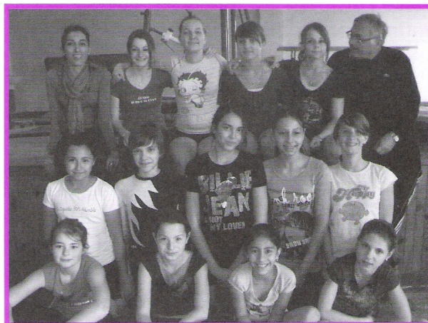
La gymnastique à l'Aiglon