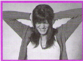
Halte au bruit!

L'enquête que nous avons menée sur les nuisances auxquelles sont confrontés les habitants des Chaprais a rencontré beaucoup de succès. Les témoignages ont afflué sur notre site, par téléphone et courrier démontrant l'attachement des chapraisiens à leur quartier et à sa tranquillité très bousculée.