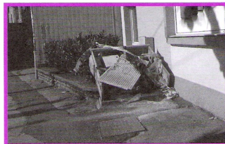
avenue Denfert-Rochereau, danger!

Cette fête se déroulera les 5 et 6 juin prochains. Son thème ? «Les Chats sont prêts». Elle proposera différents temps d'animation ouverts aux différents publics : samedi après-midi, animations jeunesse ; samedi soir, spectacles et concert tous publics ; dimanche, Garden Party dansante et bal populaire. Il est encore possible de se joindre à ce comité de pilotage de la Fête pour enrichir les animations proposées. Contacts : FJT La Cassotte : Annaïck Le Scouëzec 03 81 51 98 60 ASEP : Claude Maccotta 03 81 80 66 83