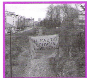
Manifestation 20 mars

Mais plus haut, ce serait la chaufferie du gymnase de l'avenue Fontaine Argent qui se déclencherait en pleine nuit, avec un bruit de moteur de camion, disent les riverains. Ces bruits seraient particulièrement audibles malgré le double vitrage des fenêtres. Cet équipement appartenant au Conseil Général, l'association lui a adressé un courrier afin de remédier à cette situation et connaître l'avenir de ces terrains qui seraient vendus à un promoteur. Le gymnase est-il inclus dans la vente ?