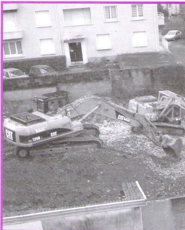
Insupportable pour le voisinage!

ou le Préfet s'il s'avère nécessaire que les travaux considérés soient effectués en dehors des heures et jours autorisés. L'arrêté portant dérogation devra être affiché de façon visible sur les lieux du chantier durant toute la durée des travaux.